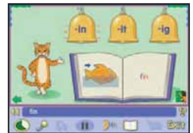
Les enfants ont du plaisir à appréhender les sons.