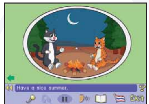
Les conversations renforcent le vocabulaire et la grammaire de chaque unité.

Ce cours repose sur une approche reconnue qui donne aux enfants de solides fondations pour développer ultérieurement leurs compétences en anglais.