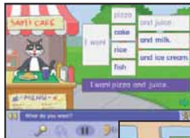
Les unités de grammaire apprennent aux enfants à construire des phrases avec les mots nouvellement acquis.